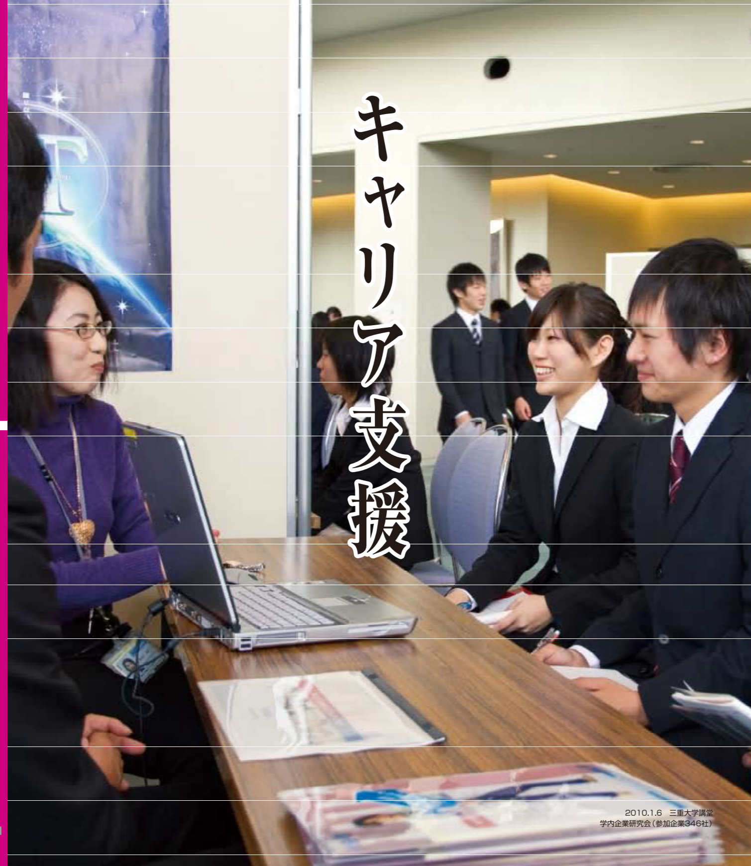
2010.1.6 三重大学講堂 学内企業研究会(参加企業346社)