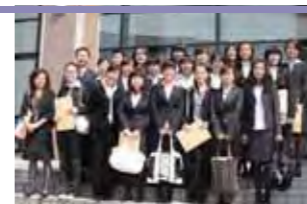
◎今年のダブルディグリー制度の留学生21名