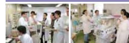
がんとマラリアの研究指導 臨床実習の様子