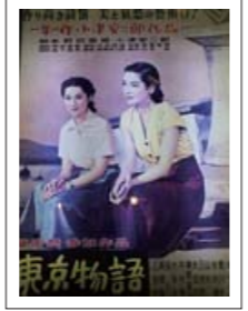
◀安二郎の代表作「東京物語」世界的に高い評価を受けています。

力や繊細さに驚きました。映画が大好きで、映画クラブをつったり、外国映画の俳優に手紙を送ったり…。映画と共に、そして映画をこよなく愛した監督の作品を一度見てみようと思いました。