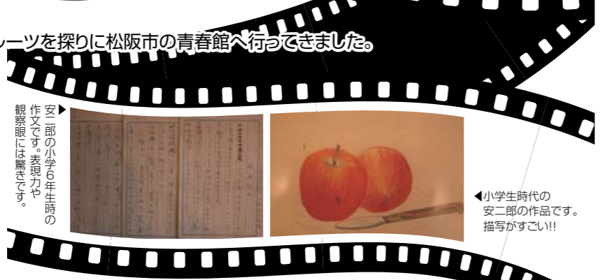
▶安二郎の小学生時代の作文です。表現力や観察力には驚かされます。