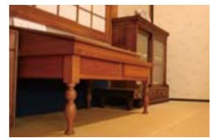
▲安二郎が学生時代に使っていた机です。安二郎のようにローアングルで撮りました。