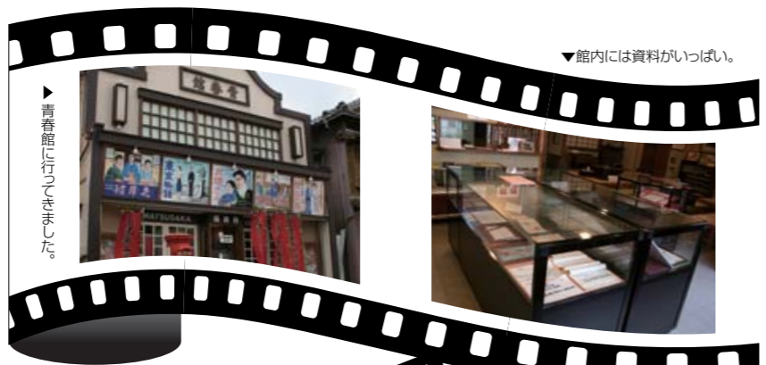
▶青春館に行ってきました。