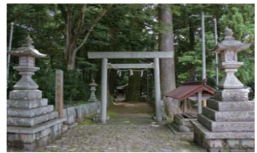
飛鳥神社の社 ：県指定天然記念物のある

賀田湾の奥、尾鷲市曾根の集落の一角に遺跡は位置しています。国道311号を挟んで北には、三重県指定天然記念物である飛鳥神社境内のクスやスギの原木が群生する杜があります。曾根遺跡は7000〜8000年前の昔から、縄文時代の終わる2000年前まで、海の民が営々とその生活を刻み続けた場所でした。 旧飛鳥幼稚園の一角を利用して開館されている曾根郷土資料館には、50年前に地元の小学生達が手伝って発掘したたくさんのお宝の石器が展示されています。ひととき目を引くのがいくつものパネルに丁寧に固定されている石鏃(いしやぶ)です。よく見るとまだ形にならない製作途中のものまであります。海辺の民ですが、漁のない時には裏山に入って狩りをしていたのでしょうか。あるいは漁や狩りには出られないが、石器作りの得意な人物が、作った石器を物々交換していたのでしょうか。そんな空想にふけさせてくれる資料です。