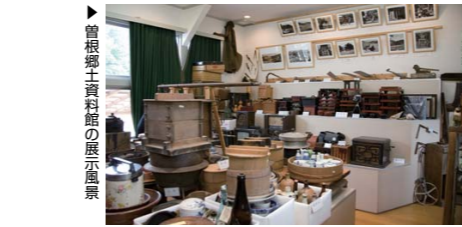
曾根郷土資料館の展示風景