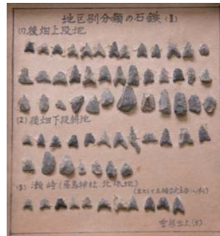
狩りに使う石鏃 ：3列目に作りかけの石鏃がある