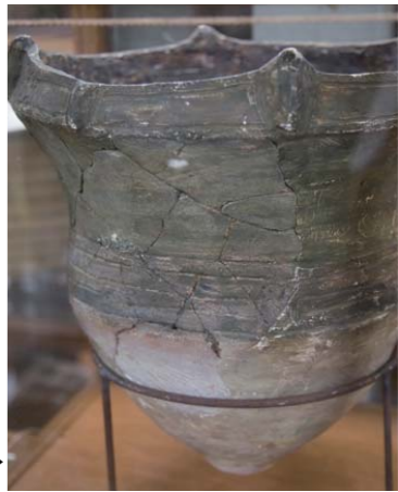
煮炊きに使う深鉢 ：海を渡ってきた土器作りの情報