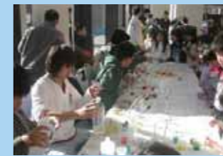
▲スライムをつくらう