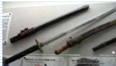
▲忍者刀 四角い柄で直刀なのは、塀を乗り越えたり急所を刺すため。