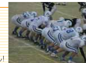
Just do it!▲

アメフトは、日本では以前はあまり知られていませんでしたが、最近では、マンガやアニメに取り上げられ、人気が高まってきました。そんなアメフトの醍醐味は、体力・知力のぶつかり合いとチームワークです。ルールはちょっと難しいで