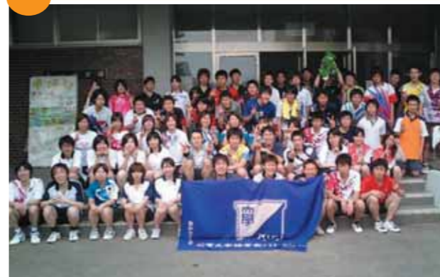
滋賀大学との定期戦を終えて(2006年6月4日、三重大大学第1体育館にて)▲