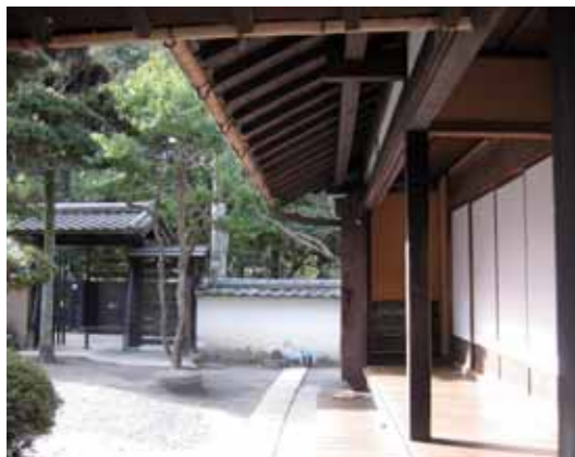
▲伊賀流忍者博物館