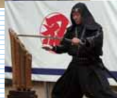
▲この切れ味を見よ！

▲忍者アクション ショーも人気です。真 剣で巻き藁や竹などを 切る姿は、かなり本 格的で迫力！(別料金) ※開催日時は当博物館まで お問い合わせください。