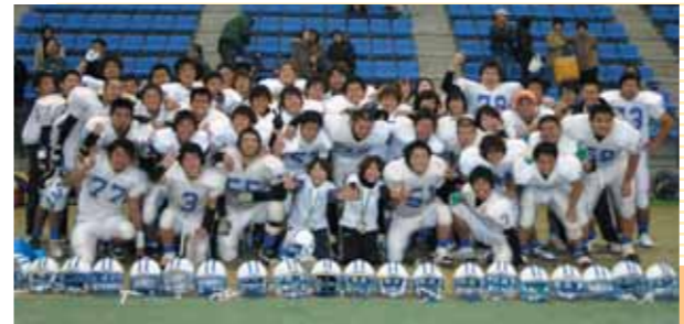
東海1部リーグに昇格決定直後の1枚。喜びの絶頂!▲

学生にしか味わえない青春の1ページを、僕たちとともにめくってみませんか。今までより手強い相手ばかりと戦うことになりましたが、東海NO.1を目指し、熱く、そして楽しく日々練習に励んでいます。今年のチーム目標は「4強崩し」、スローガンは「挑戦・飛躍」です。アメフトに興味のある人は、ぜひいつでも練習を見に来てください。待っています!