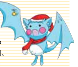
「ヴァンパイア」のマスコット「ヴァンちゃん」

私たちは、学生など若年層への献血推進活動やボランティアの重要さや大切さを伝えるための活動をしているボランティアサークルです。