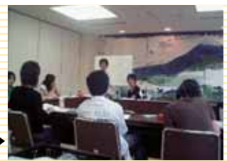
2006年9月▶ 合同会議の様子

さらに、それらの活動をより良いものにするために、三重大学体育会応援団、三重県立看護大学献血推進サークル「さくらんぼ」、県主催の高校生・専門学生が中心の献血学生ボランティア団体「ヤングミドナ」、そして私たち「ヴァンパイア」の4団体での合同会議、HPの作成等を行っています。