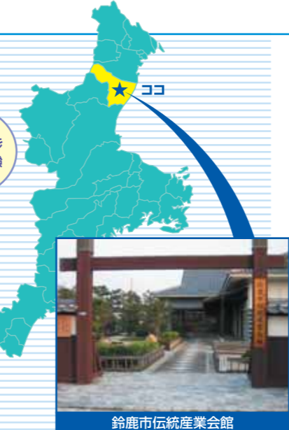
鈴鹿市伝統産業会館