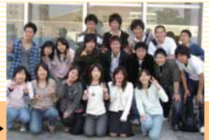
2006年5月▶ 三重県立看護大学の文化祭での献血活動

さらに、それらの活動をより良いものにするために、三重大学体育会応援団、三重県立看護大学献血推進サークル「さくらんぼ」、県主催の高校生・専門学生が中心の献血学生ボランティア団体「ヤングミドナ」、そして私たち「ヴァンパイア」の4団体での合同会議、HPの作成等を行っています。