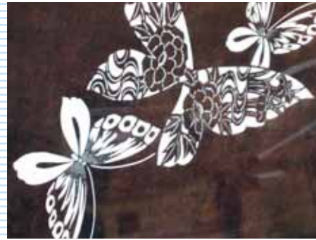
▲緻密な模様を染め上げる形紙を彫る技術は、重要無形文化財に指定されています。