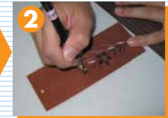
彫刻刀で絵柄を切りぬきます。