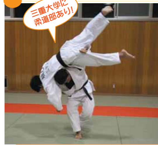
三重大学に柔道部あり!