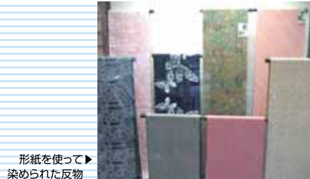
形紙を使って染められた反物