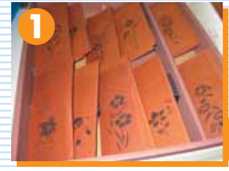
好きな柄の中から好きなしおりを選びます。