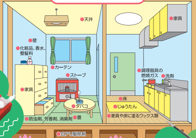
HCHO DETECTOR FP-30 (ホルムアルデヒド測定器)