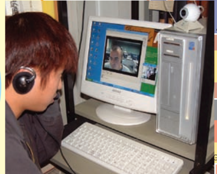
▲インターネット上の授業掲示板を使い書面での意見交換や、パソコン画面で向かい合い二人だけの音声通信（「ネットミーティング」）を行うこともあります。