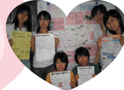
すくすく子育てクリニック