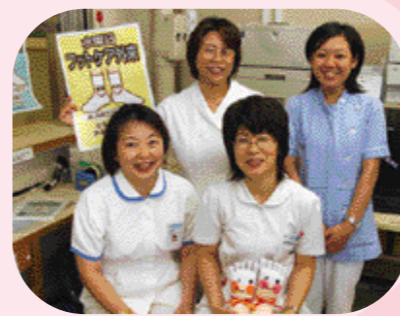
糖尿病フットケア看護外来