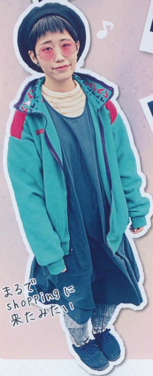
まるで shoppingに 来たみたい