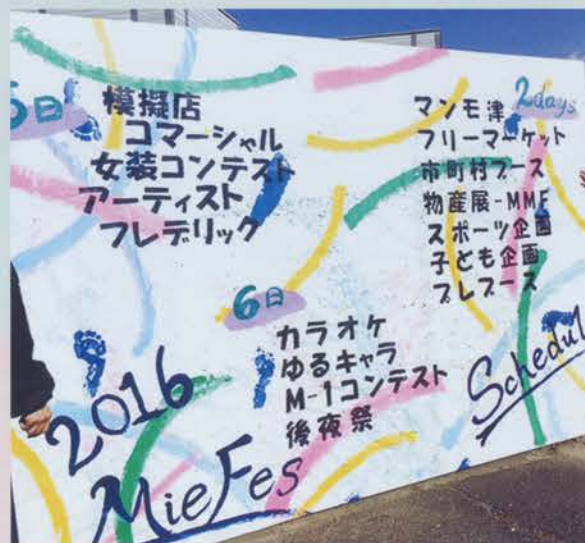
▲たくさんのイベントがずらり