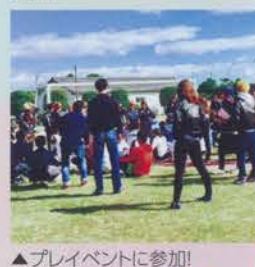
▲プレイベントに参加!