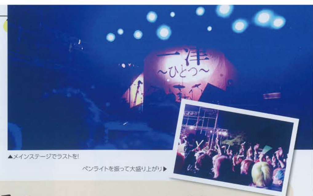
▲メインステージでラストを!

カラオケ優秀者発表や目玉のビンゴ大会などが行われます。そして学祭の最後を飾るのはレーザーショー! かなり感動的です。