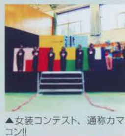
▲女装コンテスト、通称カマコン!!