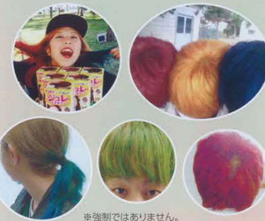
※強制ではありません。