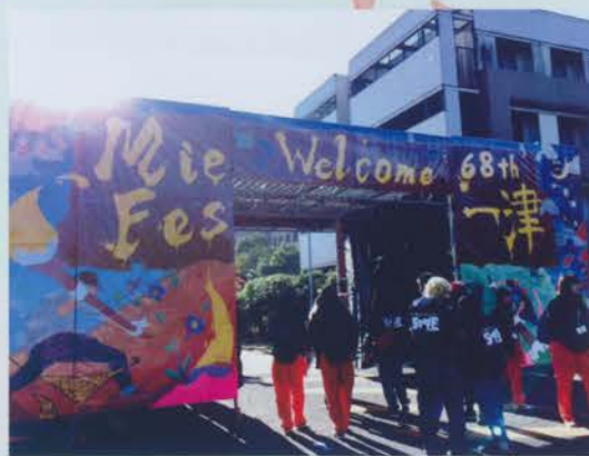
▲フオリティ高し、手作りゲート!