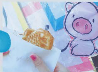
▲チョコ入りたい焼き

100店近い模擬店が大学内にずらりと並びました。毎年、各サークルや部活、学科などが様々な商品を販売しています。