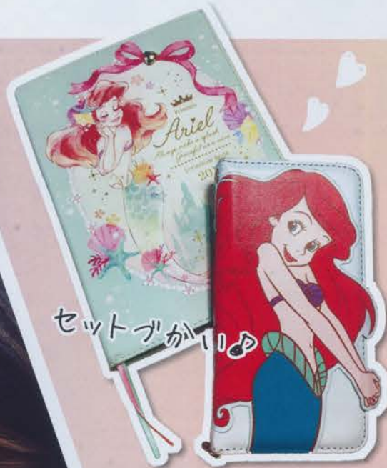
セットがかわいい