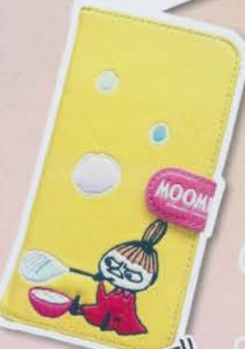
カラフルで かわいい