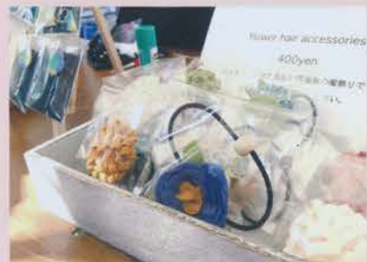
▲かわいい雑貨屋さん