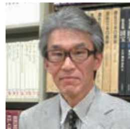
山口 泰弘 (やまぐち やすひろ) 三重大学教育学部美術教育学部教授。研究分野は美術理論および美術史で、江戸時代絵画史について専門的に研究を行っている。1982年から1997年の15年間三重県立美術館で学芸員を務めた。