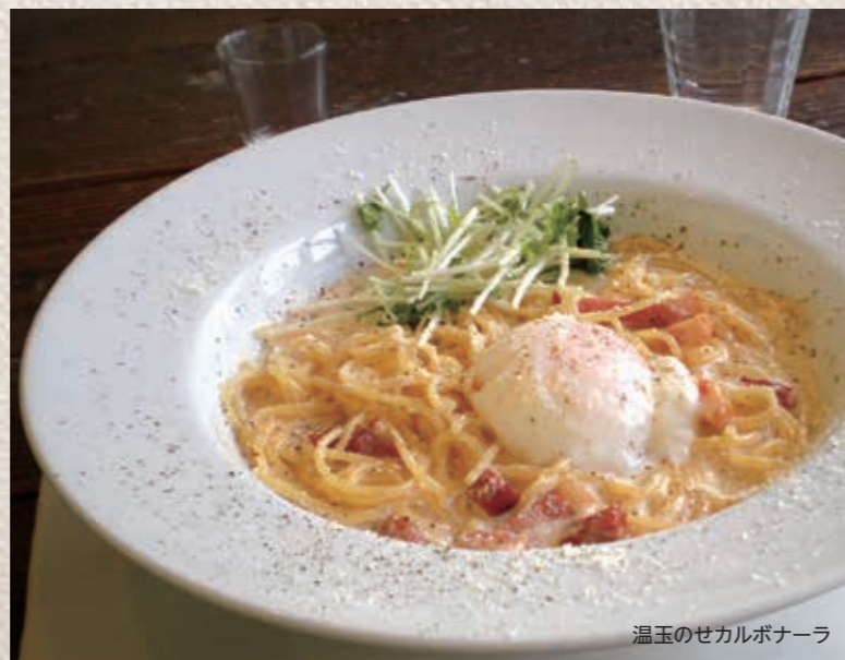
温玉のセカルボナーラ

ハチトバーブ ④ 津市島崎町9-4-2 ☎ 059-272-4358 🕒 11:00~22:00 (L.O21:00) 🗓 日曜日、月曜日 予算 ランチ1500円前後、ディナー 2000円前後