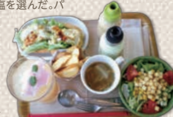
好きなドッグを選んでからつけるセット