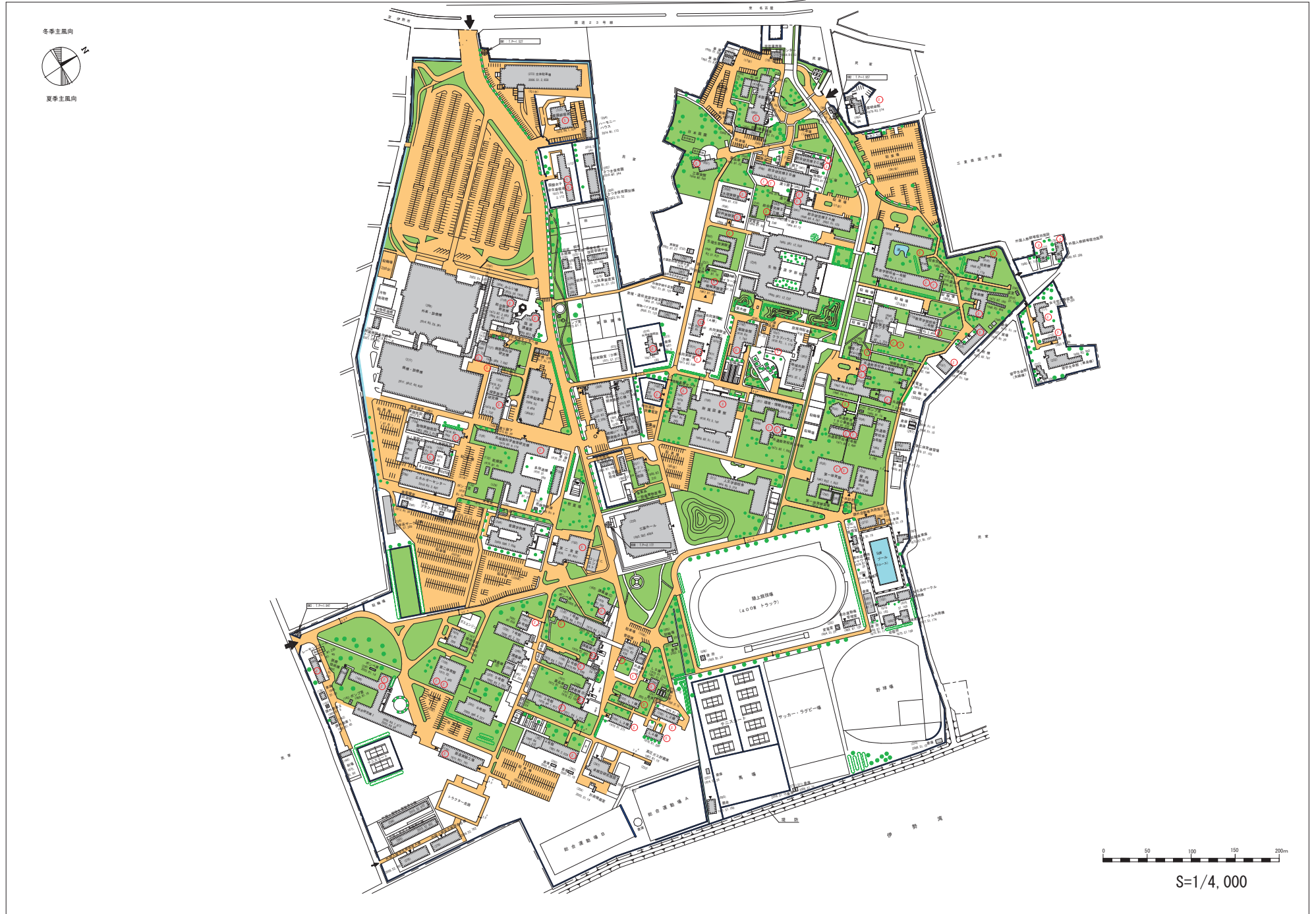
— 図面 4 —