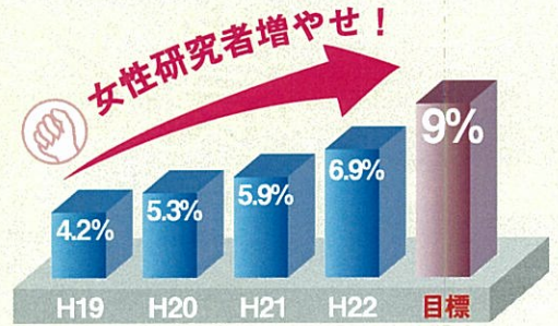
三重大理系3研究科の女性教員比率