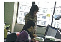
支援を受ける女性研究者(奥)とキャリア支援員(手前)