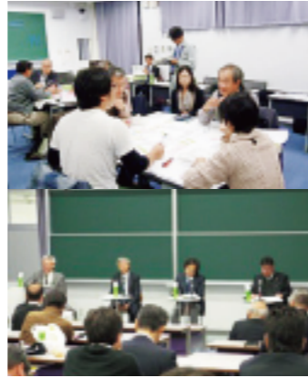
防災・減災活動を担う人材育成の様子

三重大学地域圏防災・減災研究センターは、三重県および県内市町などの行政や企業、地域の方々と連携して、三重県の防災・減災に関する人材育成や活動支援、研究の実践と成果の社会実装、災害医療支援などを実施しています。同時に三重県と共同で「三重県・三重大学 みえ防災・減災センター」を運営し、また東海圏の5つの国立大学の防災関連センターとともに「東海圏減災研究コンソーシアム」を運営するなど、南海トラフ巨大地震に備えた広域の連携体制を構築しています。