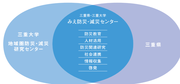
三重県・三重大学の共通するミッション