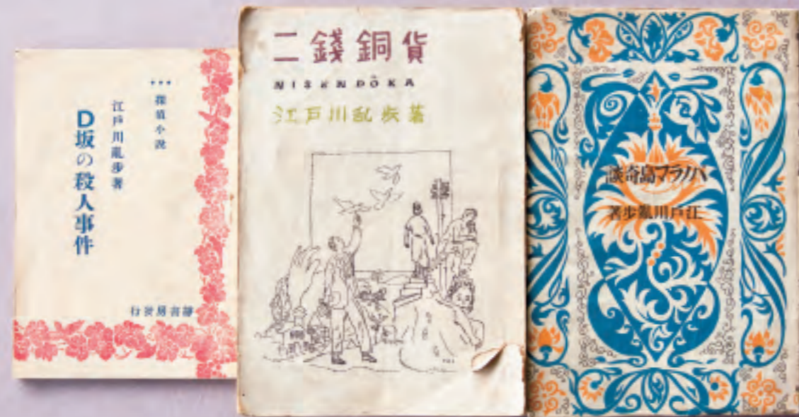
初期の作品「D坂の殺人事件」、「二銭銅貨」、「パノラマ島奇談」。(名張市立図書館蔵)