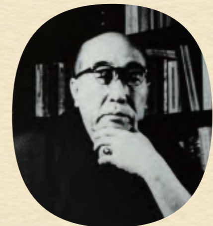
江戸川乱歩 えどがわらんぼ 推理小説家 1894年～1965年

社会の闇と人間の心の闇——探偵小説が物語の素材とするのは、犯罪の背景にある人間の暗黒面である。敗戦後、乱歩は「我々日本の探偵作家は従来ポー、ドイル直系の推理小説から離れすぎていた」と語った。乱歩によれば、「俳諧や墨絵の直観主義を決しておろそかに思うものではなかった」が、「一般に小説は俳文や日記ではないのだから、西洋風にもっと構