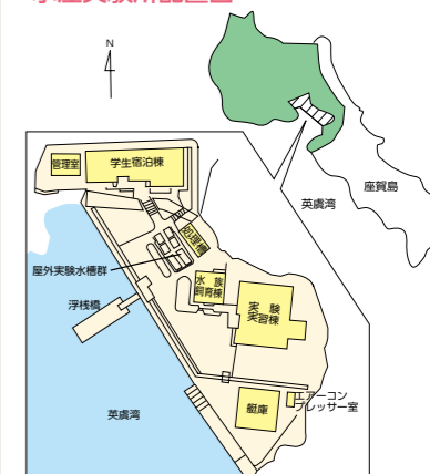
附属紀伊・黒潮生命地域フィールドサイエンスセンター附帯施設水産実験所配置図

〒517-0703 志摩市志摩町和具 4190-172 TEL0599-85-4604