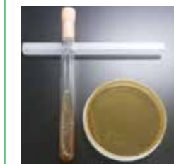
実験に使用した乳酸菌を培養する様子

ロス原液を調査したところ、タンパク質や脂肪含量が高いことがわかりました。そこで我々は、このロス原液を発酵させ固形化させることで、養殖魚や畜産の飼料として利用することを試みました。保持している乳酸菌を用いてこのロス原液を使った発酵実験を行ったところ、より利用価値の高い、栄養豊富なチーズ状の発酵産物を作製することができました。そしてこの発酵産物を使って飼育試験を行ったところ、対照区に比べて成長(体重や体長など)を高める効果があることが判明しました。今後は、この発酵産物を養殖魚や家畜などの飼料のサプリメントとして、実用化に向けた研究を行っていく予定です。