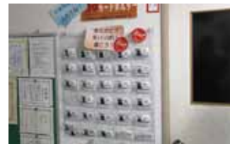
普段言えない感謝を伝える「ありがとうカード」