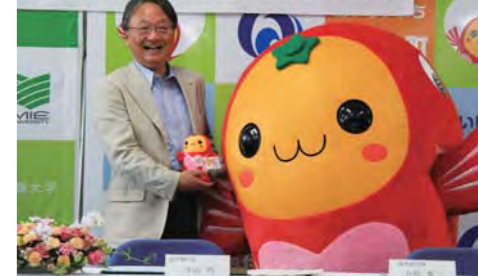
南伊勢町との協定締結式にて、たいみーと(2015.6.2)