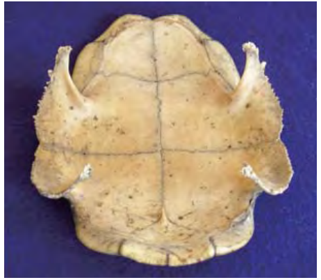
ト(うらない)に用いる亀の甲羅