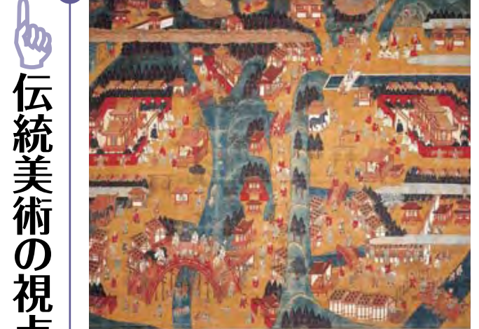
「伊勢両宮曼荼羅図」江戸時代・17世紀 紙本着色 165.4X178.7cm 一幅 神宮徴古館農業館蔵