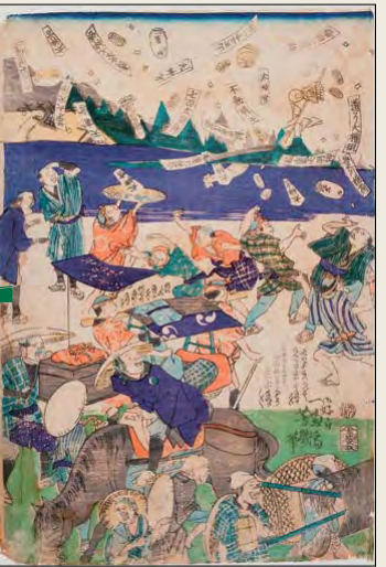
落合芳幾「おかげまいり」江戸時代・慶応3年 かめやま美術館所蔵