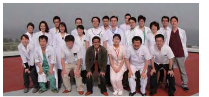
整形外科の医療チーム

技術の進歩により、現在、骨と金属の固定性は概ね満足できるものになってきました。これからの課題はやはり人工股関節の可動部分「臼蓋」と「骨頭」に代わる部分の一層の改善です。これが、より磨耗が少なく、安全かつ高機能なものになっていけば、耐用年数は現在の20年から30年~40年へと延びていきます。そして、いつかは一生使えるものになっていくことに期待が持たれています。