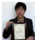
( )内は指導教員 学年は受賞当時