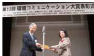
ニッショーホールにて

2010年3月1日 本学が作成した「環境報告書2009」が、環境省と(財)地球・人間環境フォーラム主催の標記大賞を受賞しました。