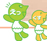
図2 北立誠小学校での環境学習