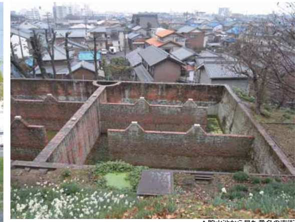
▲貯水池から見た桑名の市街