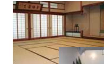
▲大広間。28畳もあって広い!