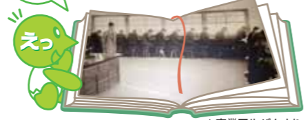
▲卒業アルバムより