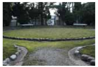
▲三翠園内。みどりがいっぱい!