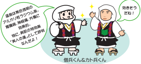
僧兵くん&カト兵くん

温泉は無色透明のアルカリ性ラジウム泉。胃腸病、神経痛、外傷に効果的。特に、美肌の特効薬「美人の湯」として評判なんだよ!