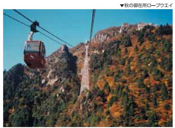
▼秋の御在所ロープウェイ