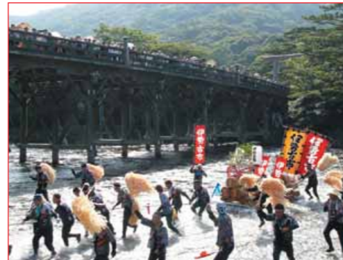
▼川曳風景。五十鈴川の中を浦田橋から内宮神域内まで、そりに乗せたご用材を曳いています。