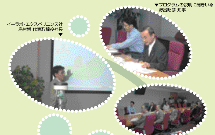
プログラムの説明に聞かせる 野呂昭彦 知事