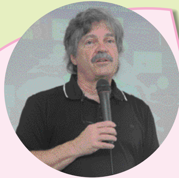
Alan, Kay 「パソコンの父」といわれているアランさんは、昨年コンピュータのノーベル賞といわれるチューリング賞を受賞、子供でも直感的に理解できるプログラム言語「Squeak」を開発した人です。日本のノーベル賞といわれる京賞も受賞しています。

お招きどうもありがとうございました。私は1940年に生まれました。幼い頃から本が好きで、よく読んだものです。私が生まれ育った時代、アメリカは世界の紛争に多くかかわっていたこともあり、様々な本を読むうちに世界には数多くの問題が存在することを知りました。 また、本を読むうちに大人が嫌いになりました。普段は常識的なことを言っているのに、戦争や問題を生み出している大人を信用できないと思い、こんな大人にならなうに科学技術についても知識を得て、この科学技術の有効に使えば、世の中の様々な問題を解決できるのではないかと考えるようになりました。今、世界は以前にもまして、紛争、貧困、環境汚染などの問題に直面しています。こういう世の中で、正しい科学技術を子ども達に伝えていくことはとても重要だと思います。 三重大学のプレゼンテーションを拝聴し、優れた技術をご紹介いただき、このフィールドサーバーのような技術の結晶が、子ども達が地球環境などを共に考え、行動と交流を即す道具となり、今後の世界を良い方へと導いてくれる事を願い、戦争のような過ちを繰り返さず、二度と悲しい出来事がおこらない事を願います。 世界の優れたプロジェクトや、子ども達への教育プログラムに対して多くの助成を行っている(私も所属している)ヒューレットパッカード社をとても誇りに思っています。どうもありがとうございました。