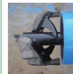
苦心の末に開発された掘削・締め固め両用のブレード

地震や豪雨などの自然災害によって発生する地盤災害に対して、適切な備えや対処方法を考えることは、安心・安全な生活にとって大変重要です。尾鍋組と共同研究を行い開発したエコジオ工法は、軟弱な地盤を砕石で強くするだけでなく、砕石の水の透し易さを利用した地盤の排水性向上および、地震時の液状化現象の予防も期待できる工法として、現在もさらなる研究開発を進めています。