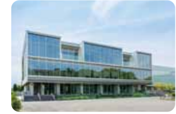
⑪ 環境・情報科学館(メープル館) 世界一の環境先進大学を目指すために、環境に関する取組等を分かりやすく展示し、環境を学べるコーナー等を設けています。