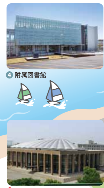
⑤ 講堂(三翠ホール) 屋根が貝殻のデザインで入学式や卒業式のほかにいろいろなイベント会場として利用されています。