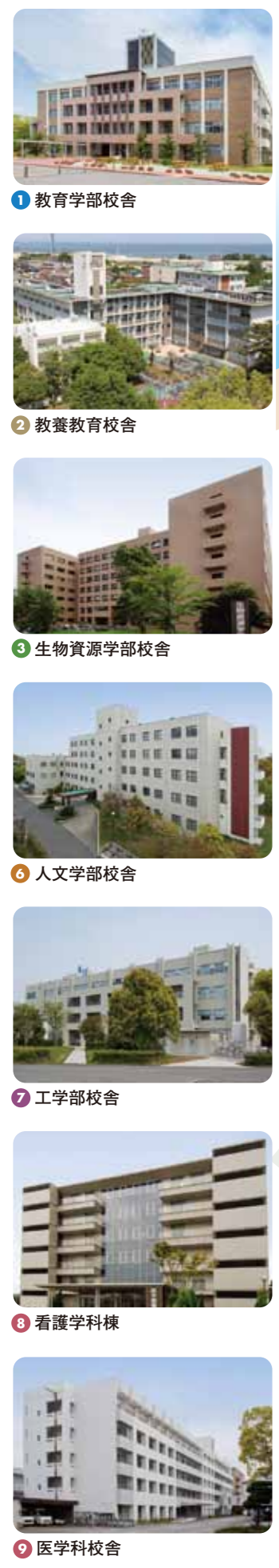
① 教育学部校舎 ② 教養教育校舎 ③ 生物資源学部校舎 ④ 附属図書館 ⑤ 講堂(三翠ホール) ⑥ 人文学部校舎 ⑦ 工学部校舎 ⑧ 看護学科棟 ⑨ 医学部校舎 ⑩ 医学部附属病院 ⑪ 環境・情報科学館(メープル館)